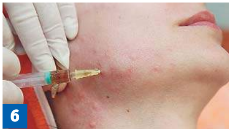
Фото 6. Введение препарата «Лаеннек» в жевательную мышцу через точку E6.