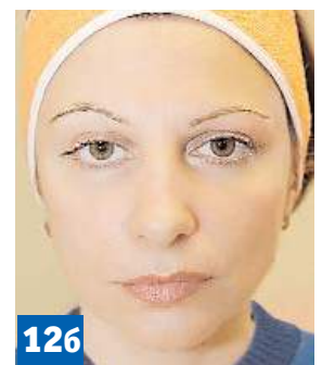
Фото 12. Пациентка до и после после курса процедур.