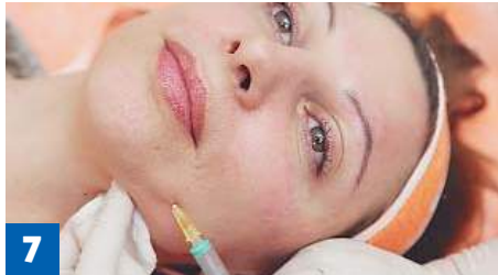
Фото 7. Введение препарата «Лаеннек» в мышцы нижней трети лица через точку E5.