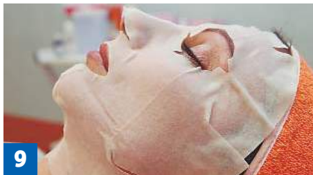
Фото 9. Нанесение плацентарной маски.