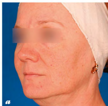
▼ Фото 2. Пациентка с мелкоморщинистым типом старения кожи лица: а — до, б — после коррекции препаратом CURACEN.

2. Мелкоморщинистый морфотип. Для коррекции множества морщин, повышения гидратации, тонуса и тургора кожи — основных проявлений ее старения при этом морфотипе — CURACEN вводим диффузно по всей поверхности лица, в классической или микропапульной технике. Используем иглу 34G длиной 6,0–8,0 мм; шаг между вколами — 1,5–2,0 см. После введения препарата рекомендовано провести легкий массаж, затем наложить нетканную, успокаивающую маску, например гиалуроново-плацентарную от Bb Laboratories или 3D плацентарную с Q10 от GHC (фото 2).